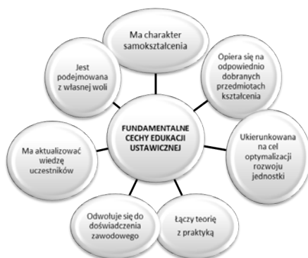
Rysunek 1. Istotne cechy kształcenia ustawicznego

Istota kształcenia ustawicznego. Wśród zebranych wypowiedzi od osób badanych, dotyczących istoty kształcenia ustawicznego, pojawiły się różne opinie i poglądy. Sprowadzić je można zasadniczo do kilku najważniejszych cech, jakie w związku z kształceniem ustawicznym typowali badani.