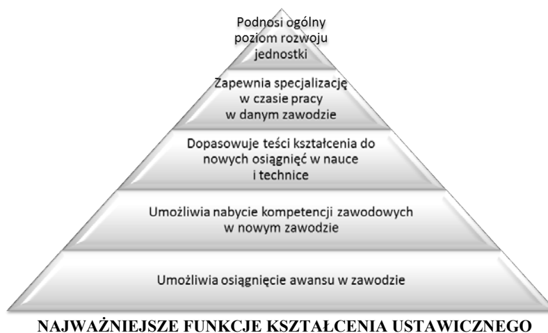
Rysunek 3. Podstawowe funkcje kształcenia ustawicznego

Rola kształcenia ustawicznego. Na pytanie dotyczące roli, jaką kształcenie ustawiczne pełni w zmieniającym się społeczeństwie, osoby badane udzieliły wielu różnych odpowiedzi. Z zebranego materiału można wysnuć pewne konstruktywne wnioski, które w coraz jaśniejszy sposób ukazują nam specyfikę obserwowanego dziś kształcenia ustawicznego.